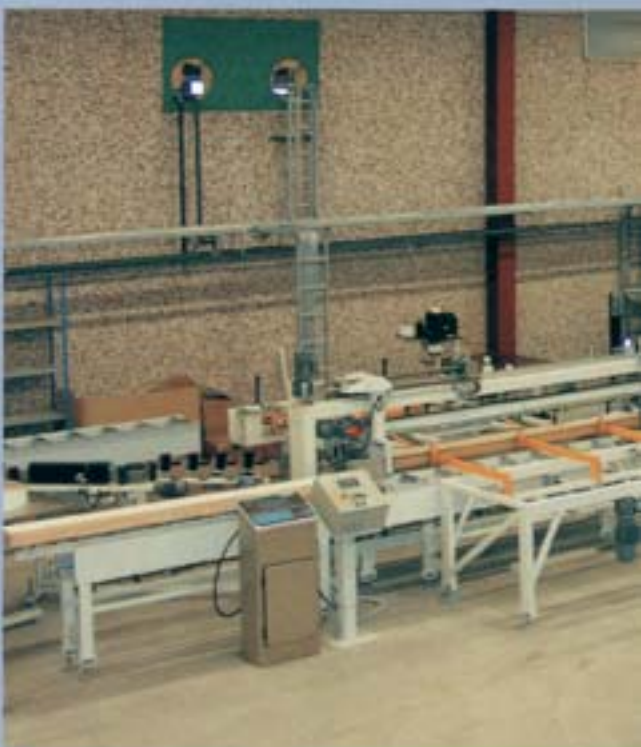
Líneas de empaquetado para tablas y tableros.