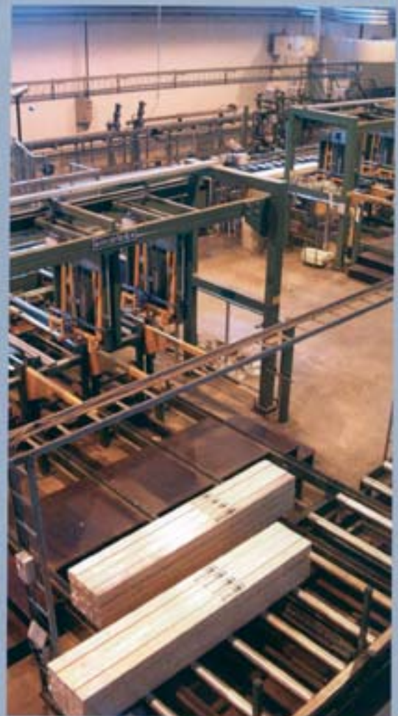
Líneas completas llave en mano para plantas de parquet.