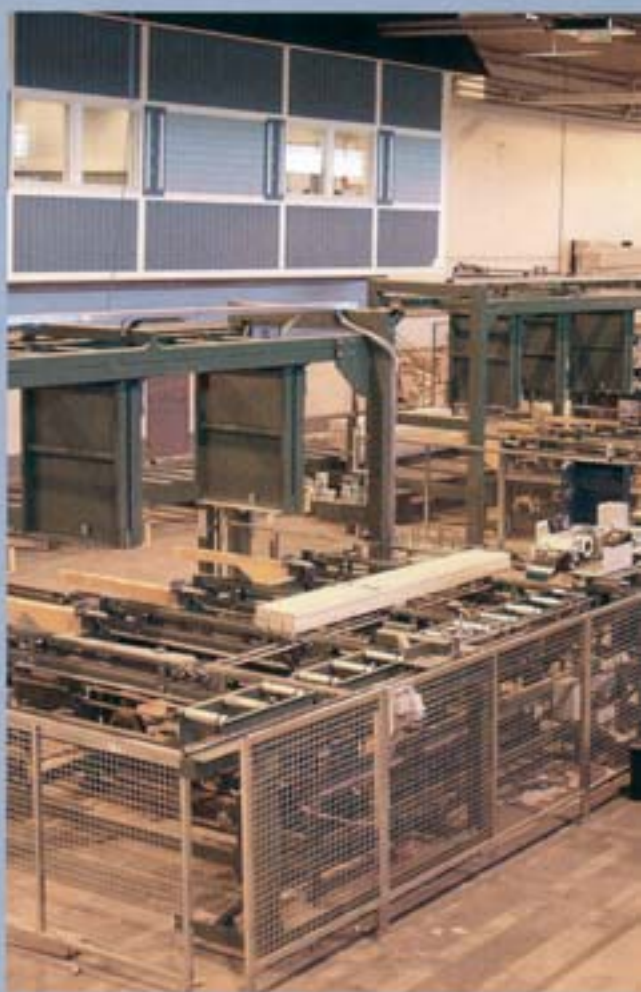
Entrega llave en mano para líneas de cepillado.

Tras diseñar el tipo de solución que demanda su sistema, también trabajamos con otros fabricantes líderes para convertir su solución en una realidad. Además trabajamos con varios suministradores de software y hardware cuando el sistema lo requiere.