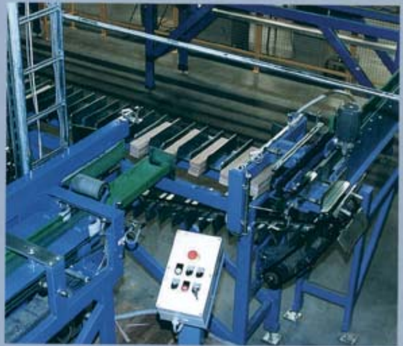
Sistemas de clasificado y transporte para tablillas para parquet.